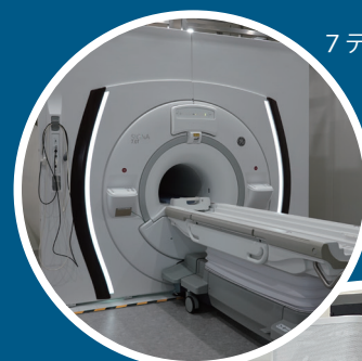
7 テスラ MRI 装置